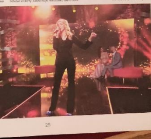
Наступ на МТЦ

—Још једна од изазова је да се осigura да сва деца имају једнаке шансе за развој. То захтева додатне напоре и средства, али је то вредно.