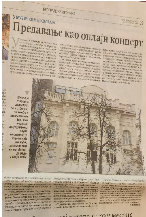
...је готова у току месеца Политика, 02.12.2020.