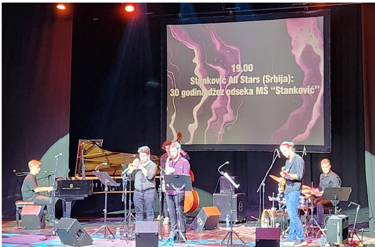
Београдски џез фестивал – Свечано отварање, Дом омладине Београда, 24.10.2023.године