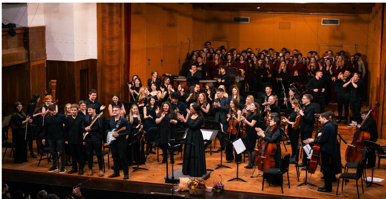
Дан школе - Коларчева задужбина 15.03.2024.