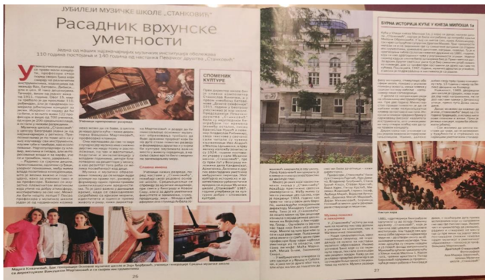
Политика Магазин, 27.06.2021.