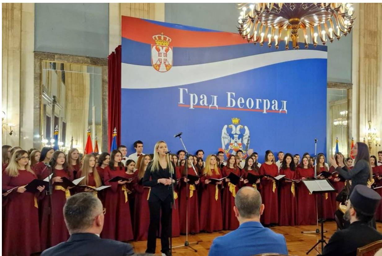
Светосавска академија – Скупштина Града 26.01.2023.године