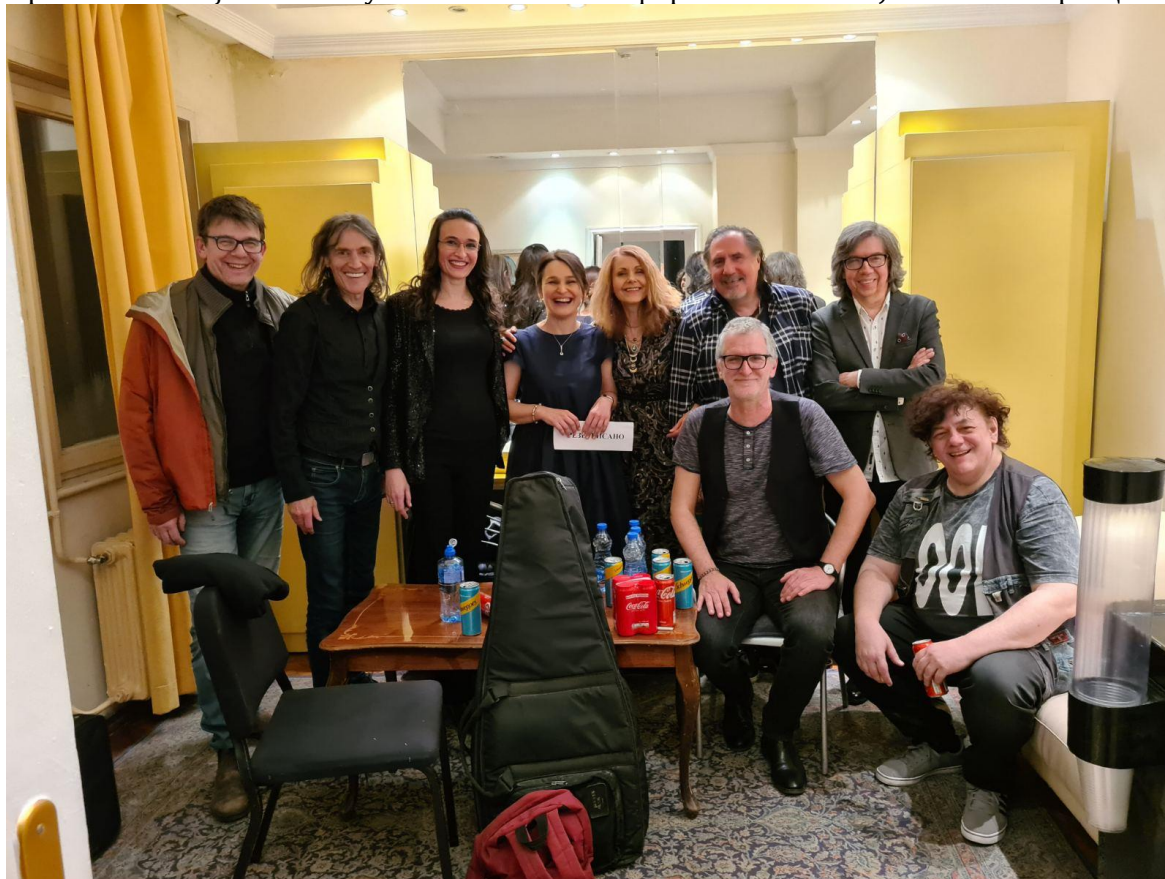
Дан школе - Коларчева задужбина 15.03.2022.

Снага наше Школе је у богатој концертној активности и јавним наступима ученика у најрепрезентативнијим салама у земљи и гостима афирмисаним извођачима и ствараоцима.