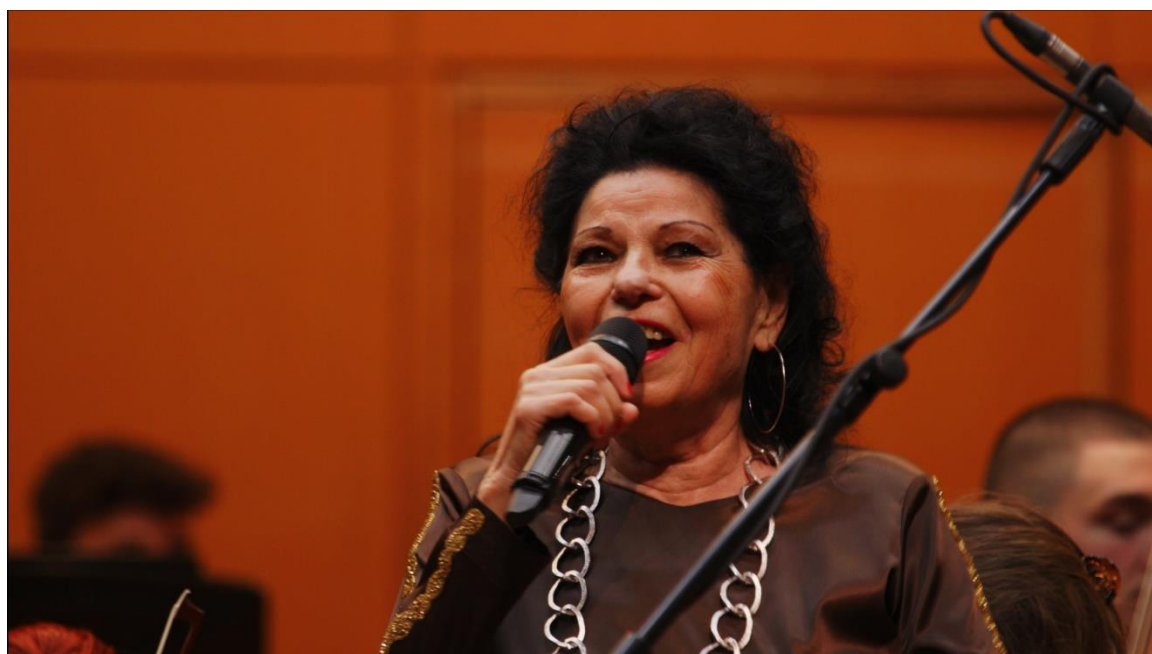
Дан школе - Коларчева задужбина 15.03.2023.